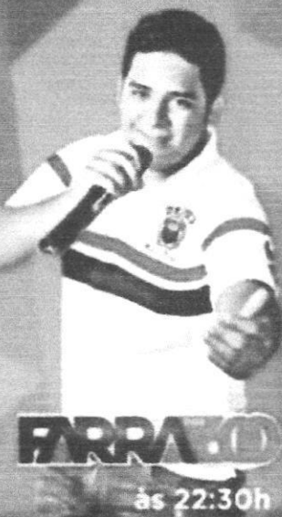
FARRÃO às 22:30h