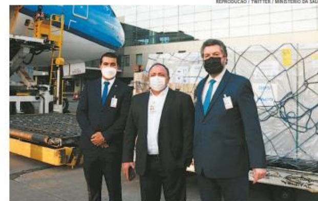
Até o maio, o país deve receber um total de 9,1 milhões de doses deste imunizante

A entrega é parte de uma primeira fase de distribuição de doses da OMS para o Brasil. O país recebeu hoje 1.022.400 de doses desse imunizante. Segundo o Ministério da Saúde, até o final deste mês de março serão entregues mais 1,9 milhão de doses do mesmo fabricante por meio dessa aliança global, que conta com a participação de mais de 150 países.