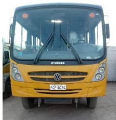
ÔNIBUS VOLARE CAIO PLACA PGP 8076 2012/2013 - DIESEL