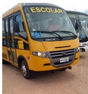
ÔNIBUS VOLARE V8 CADEIRANTE PLACA PFX 2803