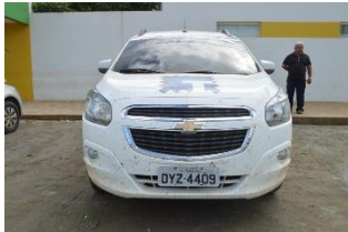
CHEVROLET SPIN LTZ – PLACA OYZ 4409 FLEX – 2014/2015 CONSELHO TUTELAR