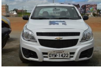
MONTANA QUEBRADA PLACA OYW 1422 FLEX – 2014/2015