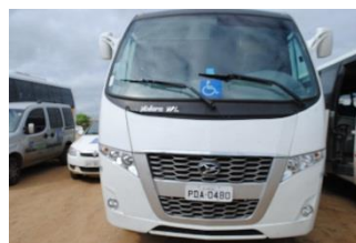
ÔNIBUS VOLARE WL PLACA PDA 0480 2017/2018 – DIESEL