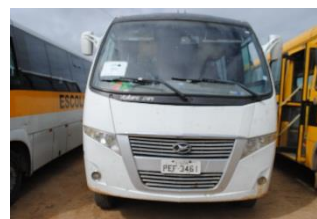
ÔNIBUS VOLARE DW9 PLACA PEF 3461 2011/2012 – DIESEL