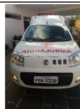
FIAT FIORINO – AMBULÂNCIA PLACA PDW 6208 FLEX – 2017