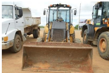
RETROESCAVADEIRA RET 0001 DIESEL – 2012