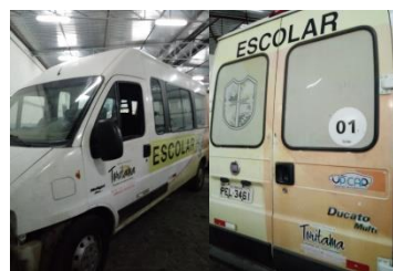
FIAT DUCATO – PLACA PEL 3461