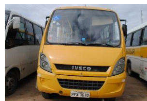
ÔNIBUS IVECO PLACA - PFX 3610 2012/2013 – DIESEL