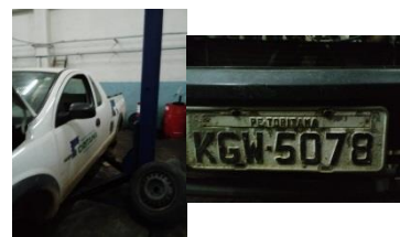
MONTANA PLACA KGW 5078 GASOLINA – 2010