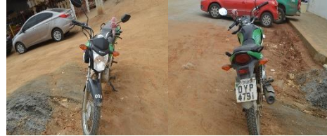
MOTO FAN ES PLACA OYP 4791 FLEX – 2104/2015