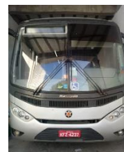
ÔNIBUS IDEALE PLACA KFZ 4237 DIESEL