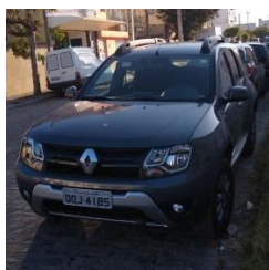
RENOR DUSTER PLACA – QOJ 4185 FLEX 2018