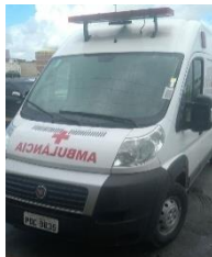
AMBULÂNCIA DO SAMU PLACA PDC 9835 2018 - DIESEL