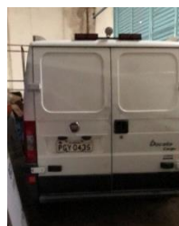
FIAT DUCATO PLACA PGY 0435 DIESEL – 2015