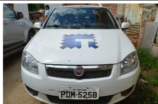
FIAT SIENA PLACA PDM 5258 FLEX – 2015 CRAS