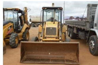
ESCAVADEIRA DIESEL – 2007