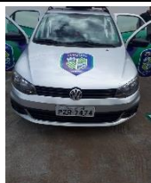
VOYAGEM PLACA PZR 7474 FLEX 2017/2018