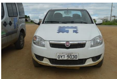
FIAT SIENA EL 1.4 PLACA OYT 9030 2014/2015 – FLEX