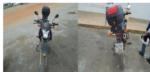
MOTO HONDA BROZ 160 PLACA PCP 1245 FLEX – 2016/2017