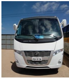
ÔNIBUSVOLARE PLACA – PDX 8136 DIESEL - 2018