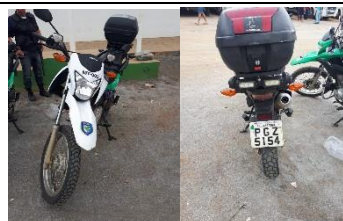
HONDA BROZ 160 PLACA PGZ 5154 FLEX – 2017