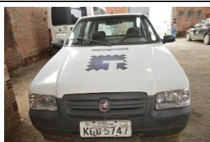
FIAT UNO MILLE WAY PLACA KGD 5747 FLEX