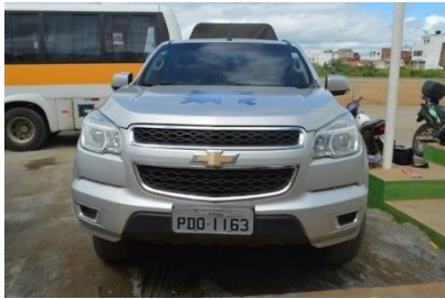
CHEVROLET S10 LT PLACA PDO 1163 GASOLINA – 2014/2015