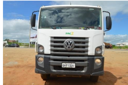
CAMINHÃO PIPA VW PLACA OYT - 1221 DIESEL – 2014