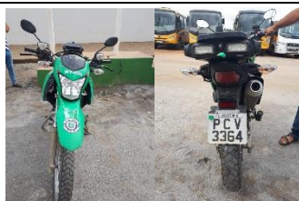
HONDA BROZ 160 PLACA PCV 3364 FLEX – 2016