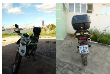
HONDA BROS 160 PLACA PCP 1265 2016/2017