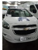
SPIN 1.8 LTZ – PLACA PCC 3382