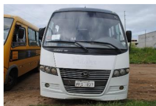
ÔNIBUS VOLARE W8 PLACA - PFG 2827 2011/2012 – DIESEL