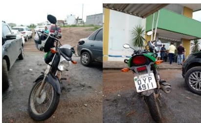
MOTOCICLETA HONDA CG 125 FAN 2014/2015 GASOLINA PLACA OYP 4911