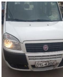
FIAT DOBLO ATRACTIV – PLACA OYL 4308 FLEX – 2014/2015