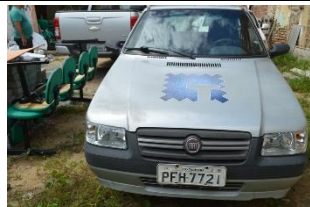
FIAT UNO PLACA PFH 7721 FLEX – 2010 BOLSA FAMÍLIA