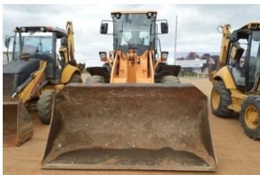
PÁ CARREGADEIRA – PCG 0001 DIESEL -2013/2014