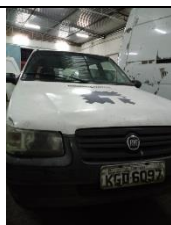
FIAT UNO MILLER WAY PLACA KGD 6097 FLEX – 2010