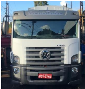
COMPACTOR PLACA PDY 2740 DIESEL 2014/2015