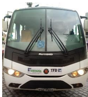
MICRO ÔNIBUS PLACA PXE 7954 DIESEL - 2015