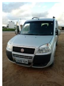
DOBLO PLACA PCF 0552 2014/2015