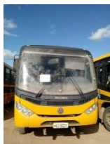
ÔNIBUS VW MARCO – PLACAPEZ 8537