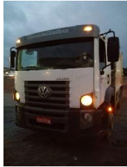
COMPACTOR PLACAPCO 3736 DIESEL2014/2015