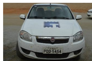
FIAT SIENA 1.4 PLACA PDQ 5454 FLEX – 2015