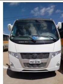
ÔNIBUS VOLARE PLACA –PDZ 6236