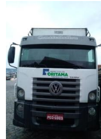
CAMINHÃO VOLKSWAGEM 13190 PLACA PGQ 6989 DIESEL – 2014/2015