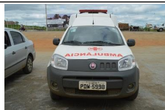
FIAT FIORINO – AMBULANCIA – PLACA PDW 5998 – FLEX – 2017