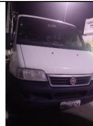
DUCATO MINIBUS PLACA PDU 1674 DIESEL 2015/2016