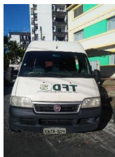
FIAT DUCATO PLACA PGO 4747 GASOLINA - 2013/2014