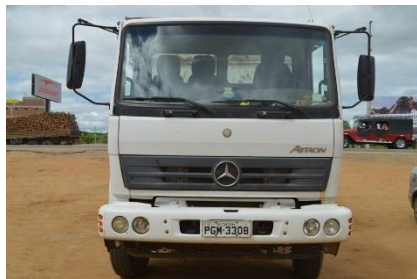
CAMINHÃO CAÇAMBA ATRON PLACA PGM-3308 DIESEL – 2013