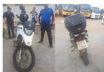
HONDA XRE300 PLACA PCN 1844 FLEX 2018