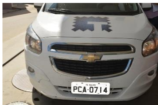
CHEVROLET SPIN LTZ – PLACA PCA 0714 FLEX - 2017 CREAS