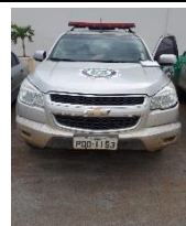
CHEVROLET S10 LT PLACA PDA 1153 FLEX – 2014