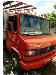
CAMINHÃO BOIADEIRO PLACA KEH 1442 DIESEL - 2001