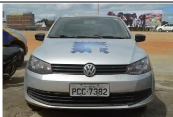
VOYAGEM PLACA PCC 7382 FLEX – 2014