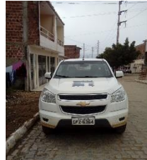
CHEVROLET S10 PLACA GFZ 6364 GASOLINA – 2016