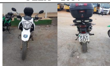
HONDA BROZ 160 PLACA PGY 2231 FLEX – 2015