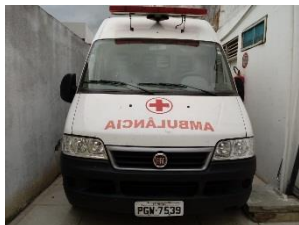
FIAT DUCATO PLACA PGW 7539 DIESEL – 2017/2018