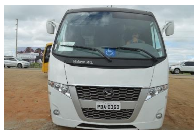
ÔNIBUS VOLARE WL PLACA PDA 0360 2017/2018 – DIESEL