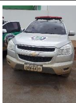
CHEVROLET S10 LT PLACA ORM 4437 FLEX – 2015