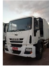
COMPACTOR PLACA PDG 0258 DIESEL 2015