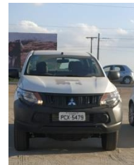
L200 TRITON VIGILANCIA SANITARIA PLACA PCX 5479 2018 - DIESEL