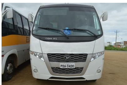
ÔNIBUS VOLARE WL PLACA - PDA 0400 2017/2018 – DIESEL