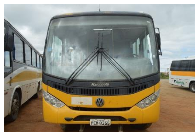
ÔNIBUS MARCOPOLO VOLKSVAGE PLACA PEW 8355 2011/2011 -DIESEL