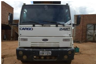
CAMINHÃO CAÇAMBA CARGO PLACA GXK-1379 DIESEL 1998