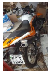
MOTO NXR 160 BROS PLACA PCT 1248 FLEX - 2018