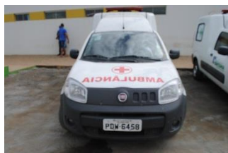
FIAT FIORINO – AMBULÂNCIA – PLACA PDW 6458 – FLEX – 2017