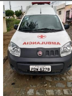
FIAT FIORINO AMBULÂNCIA PLACA PDW 6278 FLEX 2017/2018