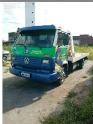
CAMINHÃO REBOQUE PLACA DJE 1419 DIESEL - 2001