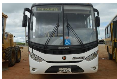
ÔNIBUS AGRALE IDEALE PLACA PEM 3202 2011/2012 – DIESEL