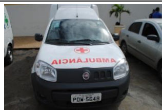
FIAT FIORINO – AMBULÂNCIA – PLACA PDW 5648 FLEX – 2017