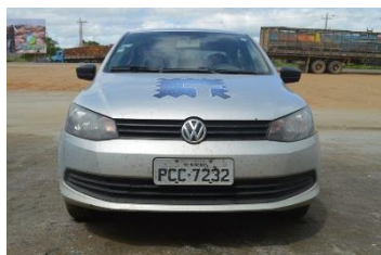
VOYAGEM – PLACA PCC 7232 FLEX – 2014/2015