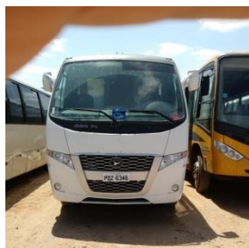
ÔNIBUS VOLARE PLACA – PDZ 6346