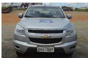
CHEVROLET S10 LT DD4 PLACA OYU 1007 GASOLINA – 2014