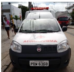
FIAT FIORINO AMBULÂNCIA PLACA PDW 6368 FLEX – 2017/2018