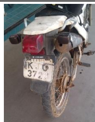
MOTO XTZ 125K PLACA KJQ 3727 GASOLINA – 2005