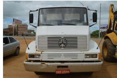
CAMINHÃO CAÇAMBA MERCEDES BRANCO PLACA GQY-2556 –DIESEL – 1994 –