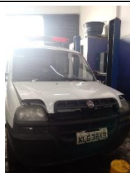
FIAT DOBLO PLACA KLG 3849 GÁS – 2009