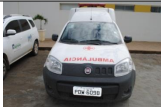
FIAT FIORINO – AMBULÂNCIA – PLACA PDW 6098 FLEX – 2017