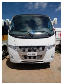
ÔNIBUS VOLARE PLACA PCG 6987