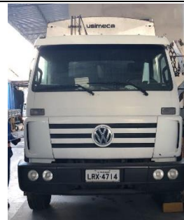
COMPACTOR PLACA LRX 4714 DIESEL 2014