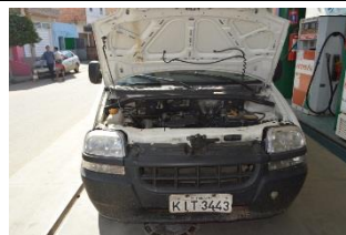
FIAT DOBLO CARGO PLACA KIT 3443 GÁS – 2005