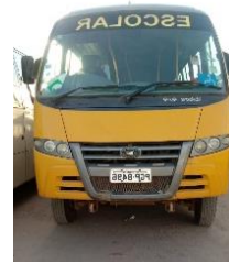
ÔNIBUS VOLARE PLACA – PGP 8496 2012/2013 - DIESEL