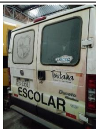
FIAT DUCATO PLACA OYL 3330