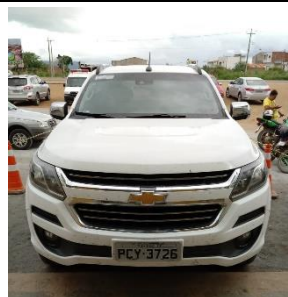
TRAILBLAZER PLACA PCY 3726 GASOLINA 2017/2018