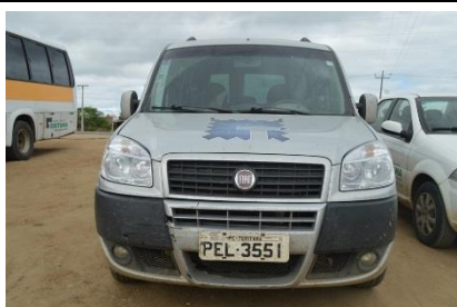
FIAT DOBLO ATRACTIV PLACA PEL 3551 2011/2012 – FLEX