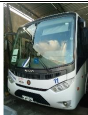
ÔNIBUS MARCOPOLO PLACA KJM 7864 DIESEL