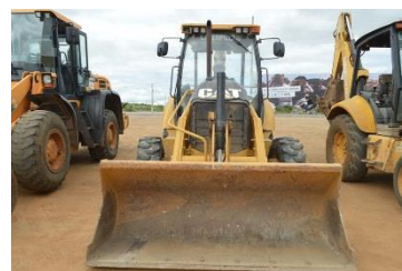
RETROESCAVADEIRA RET 0002 DIESEL2013