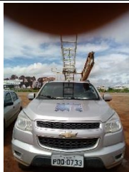
S10 PLACA PLACA PDO 0733 GASOLINA 2014/2015 -