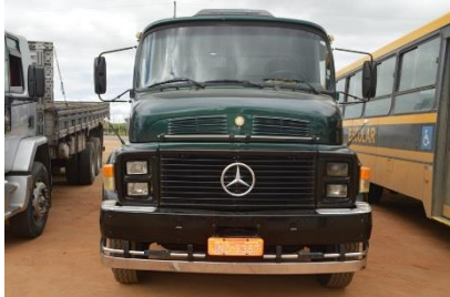
CAMINHÃO CAÇAMBA MERCEDES PLACA JNZ-5357 – 1964 - DIESEL-