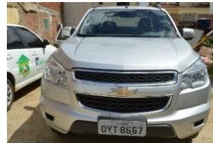
CHEVROLET S10 LT PLACA OYT 8667 GASOLINA – 2014