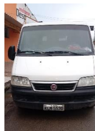
FIAT DUCATO PLACA KLN 5530 DIESEL