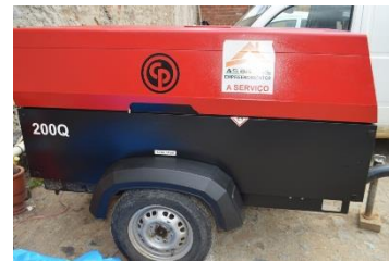
PERFURATRIZ PNEUMATICA DIESEL PFP 001 - ANO 2015