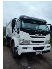
COMPACTADOR PLACA OYS 5267 DIESEL - 2013/2014