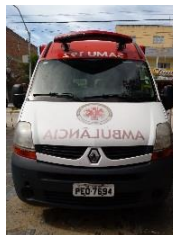
RENOUT MASTERAMB PLACA PEO 7694 DIESEL – 2012/2013