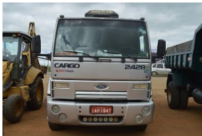
CAMINHÃO FOR TRUCK 2428 PLACA IAH 1647 DIESEL 2008/2009