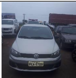
GOL PLACA PEA 5709 FLEX – 2017/2018