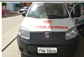
FIAT FIORINO – AMBULÂNCIA PLACA PDW 5808 – FLEX – 2017