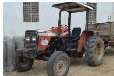
FERGUSON 250X2 – DIESEL – FER0001 - ANO 2000