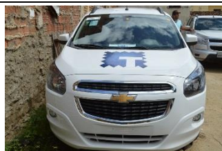
CHEVROLET SPIN LTZ PLACA PDP 7865 FLEX – 2018 BOLSA FAMÍLIA