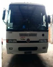
ÔNIBUS MARCOPOLO PLACA MUJ5350 DIESEL