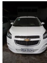
CHEVROLET SPIN LTZ PLACA PCA 0524 FLEX – 2017 ASSISTÊNCIA SOCIAL