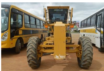
MOTONIVELADORA MTN 0001 DIESEL - 2013