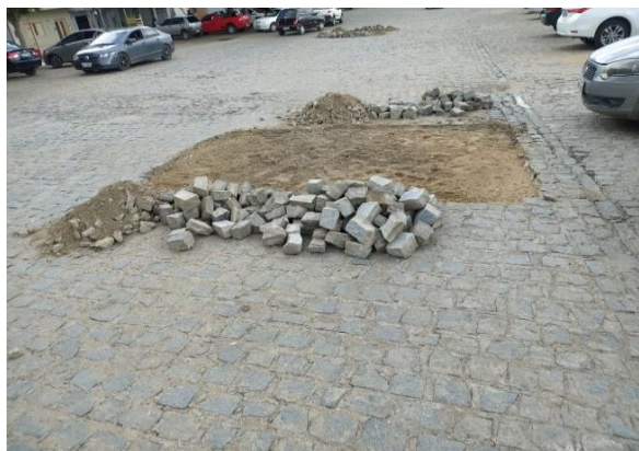
Rua Antonio Soares