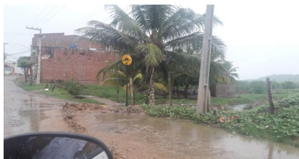
Rua Iraci Teixeira da Silva