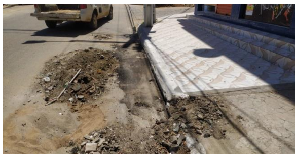
Rua Adalgiza Moura