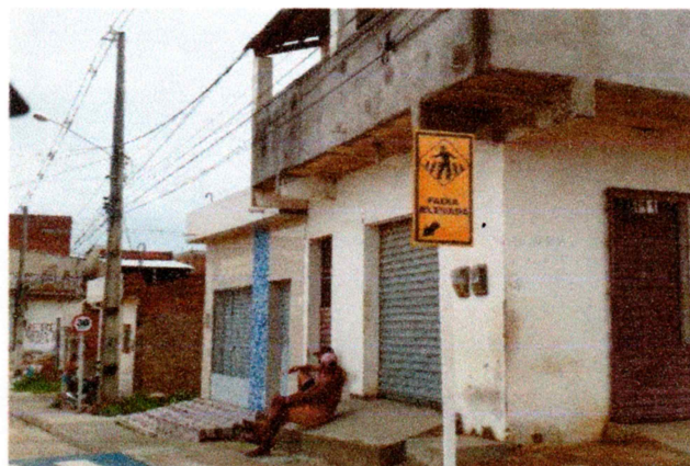
Foto-16 (Avenida Prefeito Gerson Pereira (Complemento da Av. Romeu Simplicio) - SINALIZAÇÃO VERTICAL