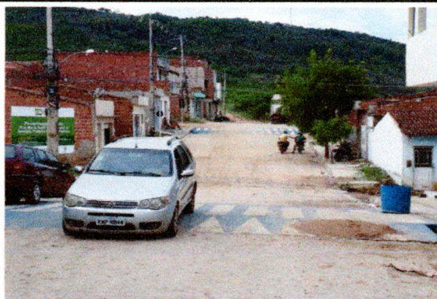
Foto-02 (Avenida Prefeito Gerson Pereira (Complemento da Av. Romeu Simplicio) - concluída