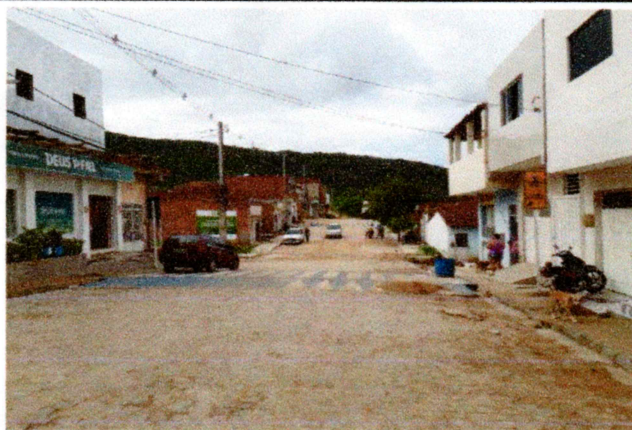
Foto-01 (Avenida Prefeito Gerson Pereira (Complemento da Av. Romeu Simplicio) - concluída

MODALIDADE.: Tomada de Preço N.º 003/2018