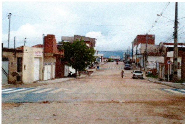
Foto-13 (Avenida Prefeito Gerson Pereira (Complemento da Av. Romeu Simplicio) - FAIXA ELEVADA

MODALIDADE.: Tomada de Preço N.º 003/2018