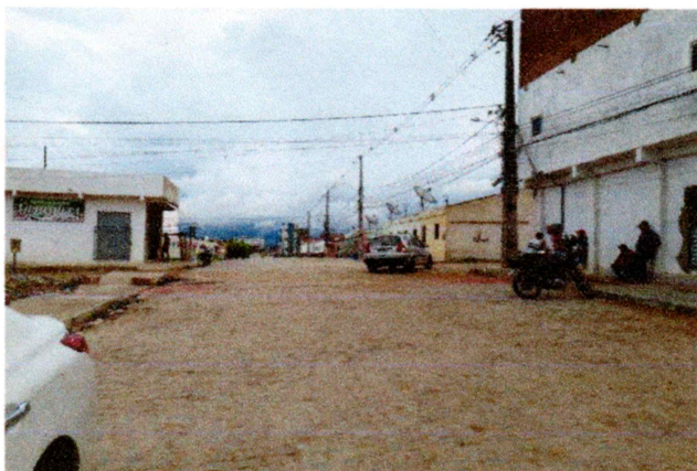
Foto-03 (Avenida Prefeito Gerson Pereira (Complemento da Av. Romeu Simplicio) - concluída