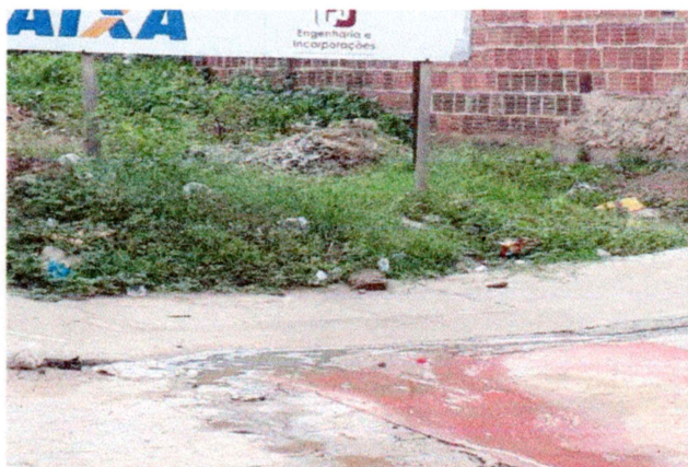
Foto-04 (Avenida Prefeito Gerson Pereira (Complemento da Av. Romeu Simplicio) - ROTA ACESSIVEL