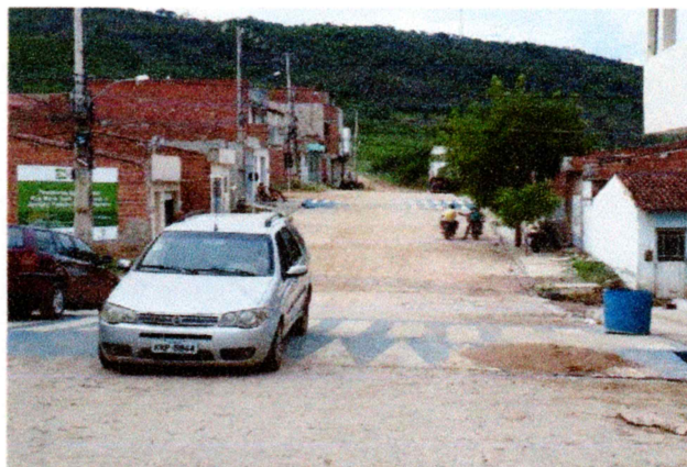
Foto-14 (Avenida Prefeito Gerson Pereira (Complemento da Av. Romeu Simplicio) - FAIXA ELEVADA