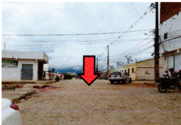
Foto-15 (Avenida Prefeito Gerson Pereira (Complemento da Av. Romeu Simplicio) - ROTA ACESSIVEL