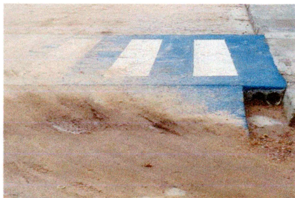
Foto-17 (Avenida Prefeito Gerson Pereira (Complemento da Av. Romeu Simplicio) - SINALIZAÇÃO HORIZONTAL