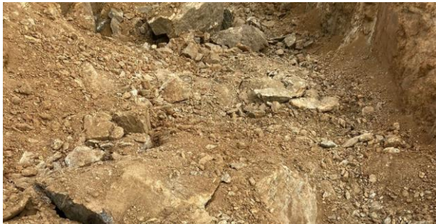
Escavação de valas em material de 3ª categoria p/ fundação dos muros de contenção (Fundos)