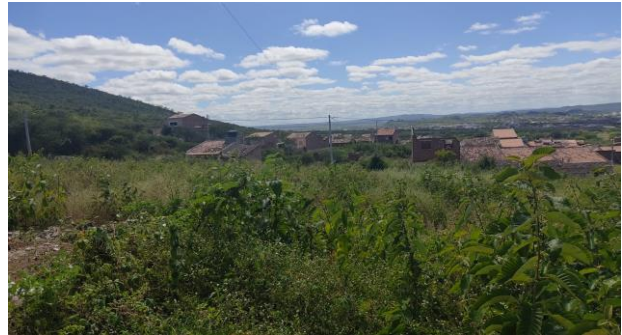
Terreno antes da limpeza e remoção de entulho para início das obras