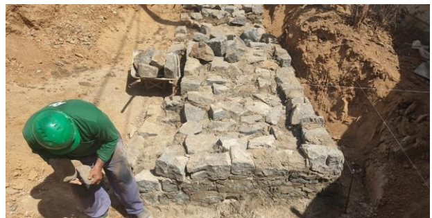
Construção do muro de contenção (Lado direito)