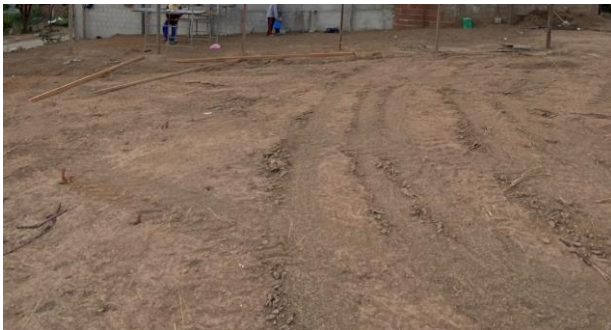
Terreno após a limpeza e remoção dos entulhos