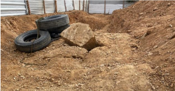
Escavação de valas em material de 3ª categoria p/ fundação dos muros de contenção (Lado esquerdo)