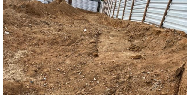
Escavação de valas em material de 3ª categoria p/ fundação dos muros de contenção (Lado esquerdo)