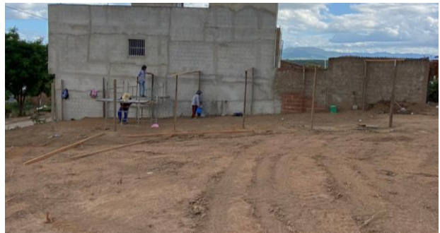
Construção do barracão de obra e abrigo p/ materiais e equipamentos