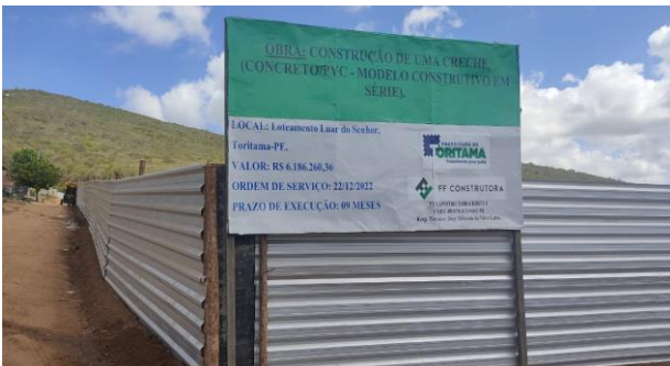
Placa da obra c/ tampume executado