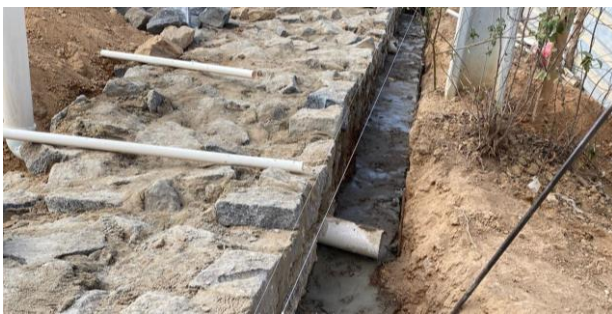
Construção do muro de contenção (Lado direito)