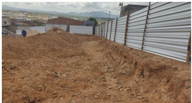
Escavação de valas em material de 1ª categoria p/ fundação dos muros de contenção (Lado esquerdo da obra)