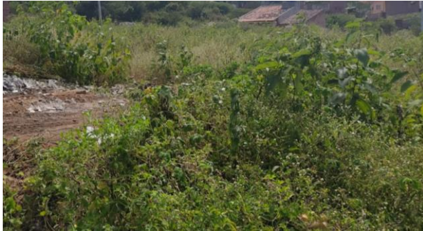
Terreno antes da limpeza e remoção de entulho para início das obras