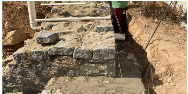
Construção do muro de contenção (Lado direito)