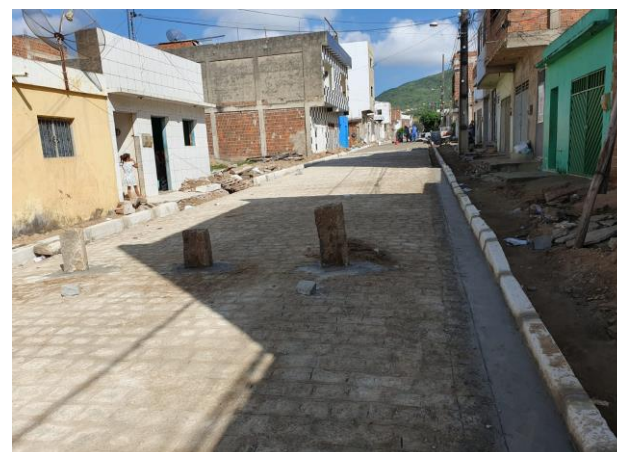
FOTO-04 - Pavimento da Rua Everaldo Guedes