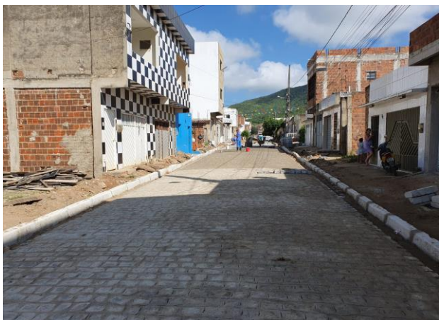
FOTO-03 - Pavimento da Rua Everaldo Guedes