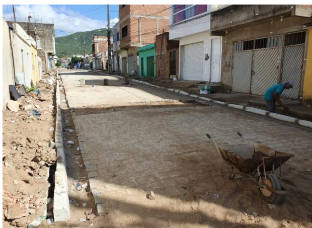
FOTO-01 - Pavimento da Rua Everaldo Guedes