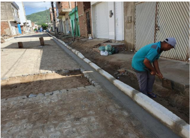
FOTO-05 - Pavimento da Rua Everaldo Guedes