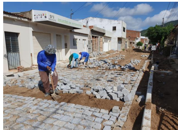
FOTO-06 - Pavimento da Rua Everaldo Guedes