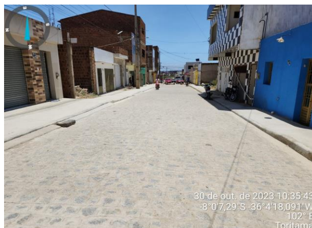
FOTO-02 - Pavimento da Rua Everaldo Guedes