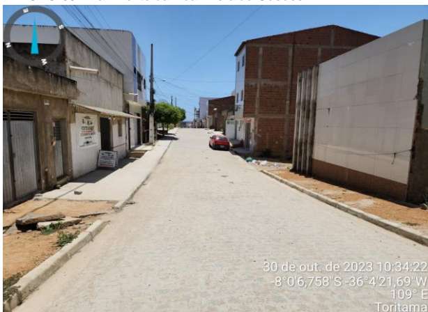
FOTO-11 - Pavimento da Rua Everaldo Guedes