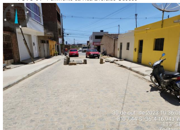
FOTO-06 - Pavimento da Rua Everaldo Guedes