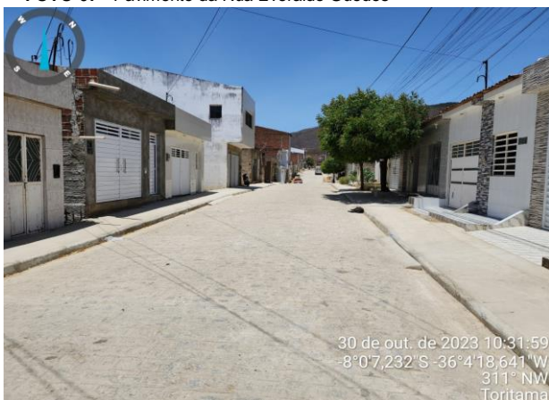
FOTO-09 - Pavimento da Rua Everaldo Guedes