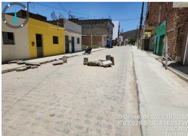
FOTO-03 - Pavimento da Rua Everaldo Guedes