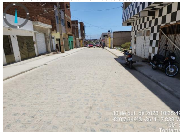
FOTO-10 - Pavimento da Rua Everaldo Guedes