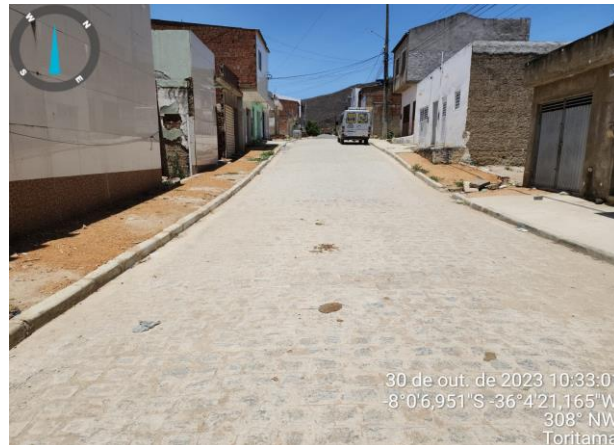
FOTO-04 - Pavimento da Rua Everaldo Guedes