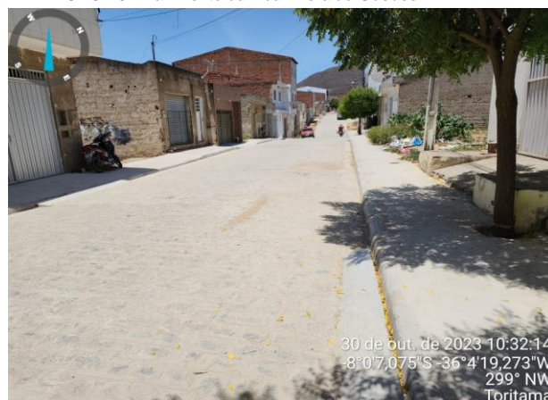
FOTO-12 - Pavimento da Rua Everaldo Guedes