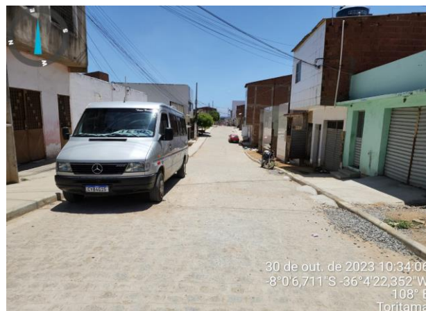
FOTO-08 - Pavimento da Rua Everaldo Guedes