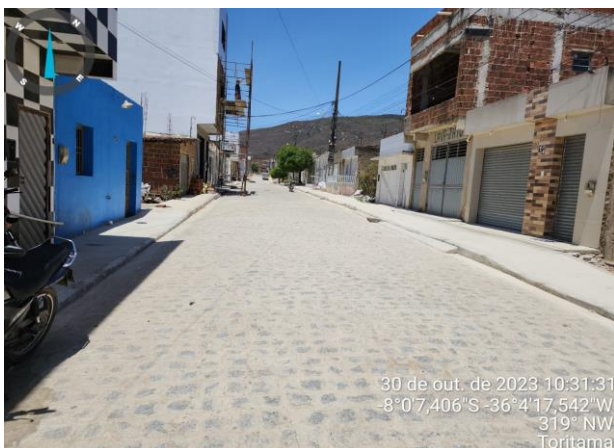
FOTO-07 - Pavimento da Rua Everaldo Guedes