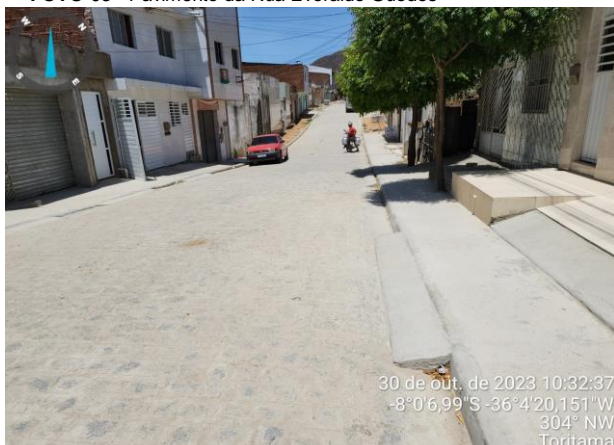
FOTO-05 - Pavimento da Rua Everaldo Guedes