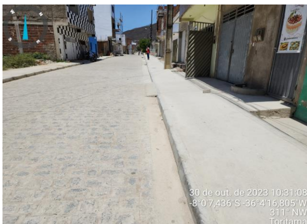
FOTO-01 - Pavimento da Rua Everaldo Guedes