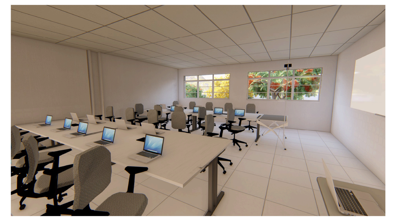
Imagem do modelagem de vestuário