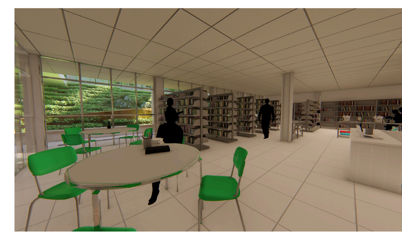
Imagem da Biblioteca