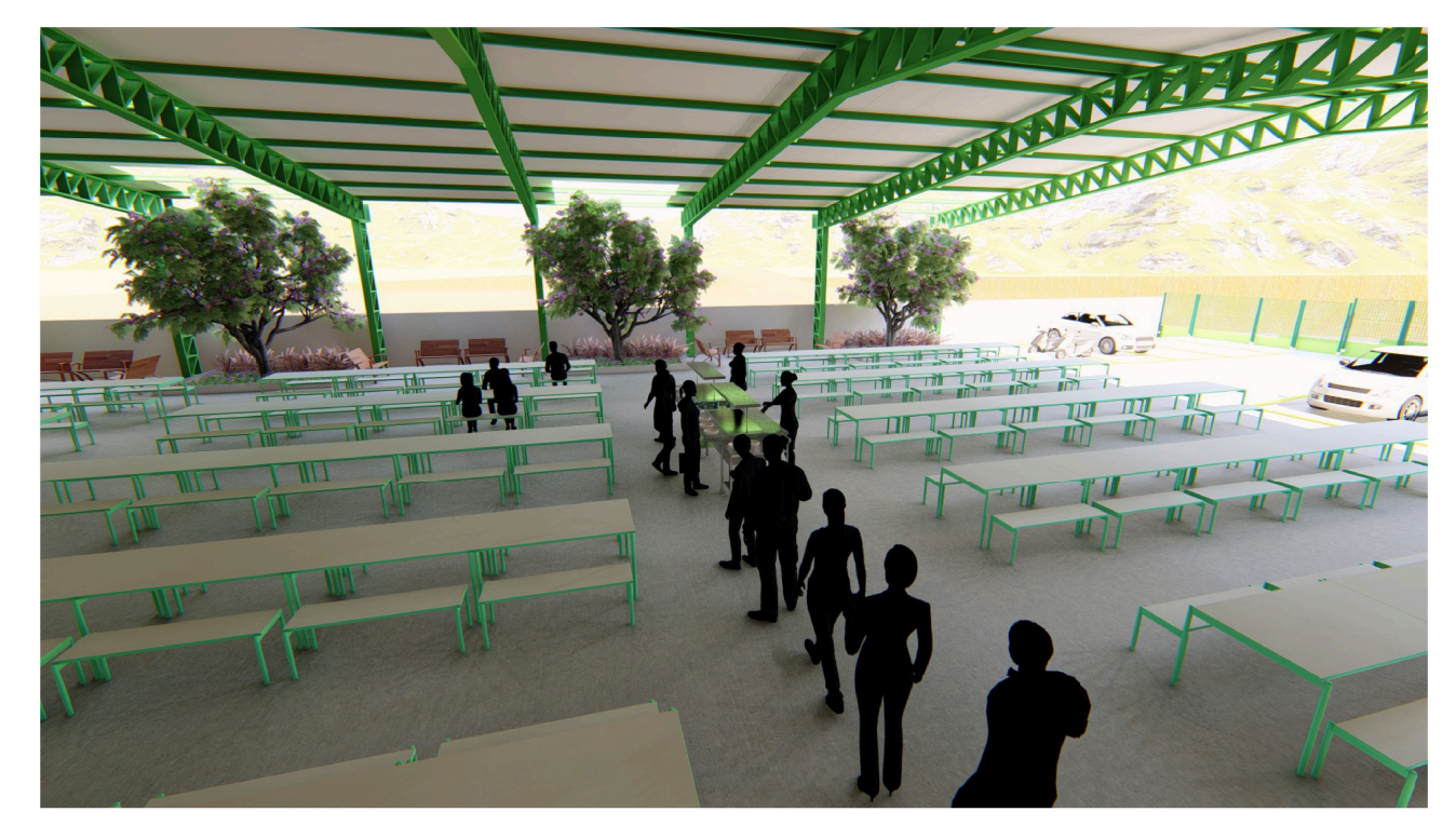
Imagem do refeitório