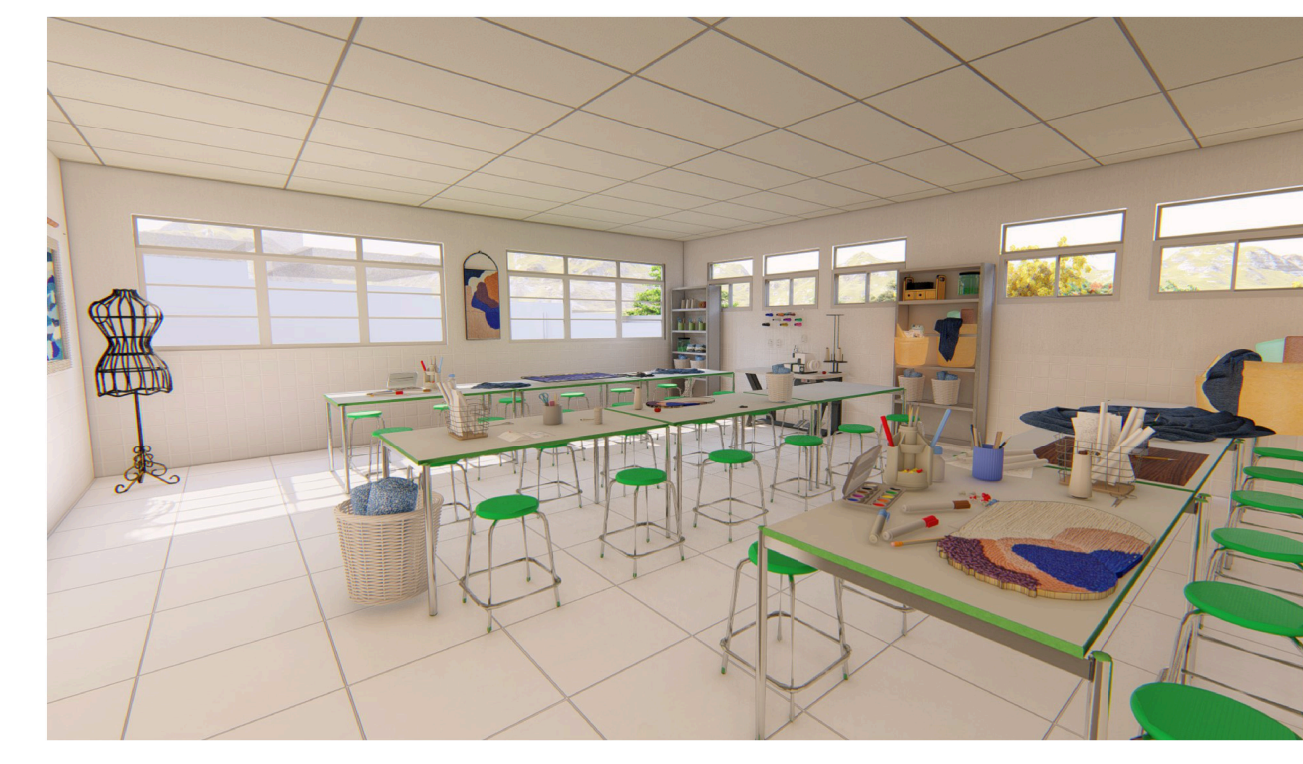
Imagem do laboratório de artes e sustentabilidade