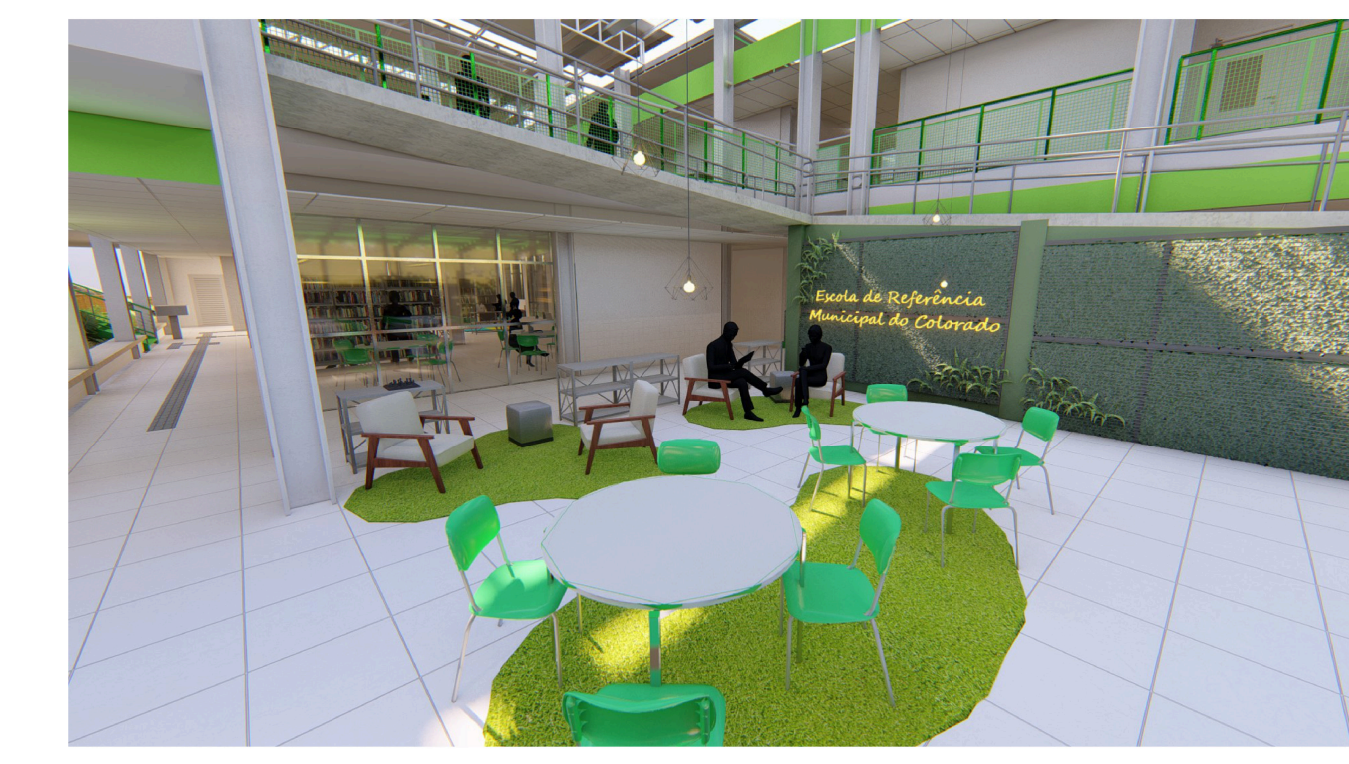
Imagem da área de convívio