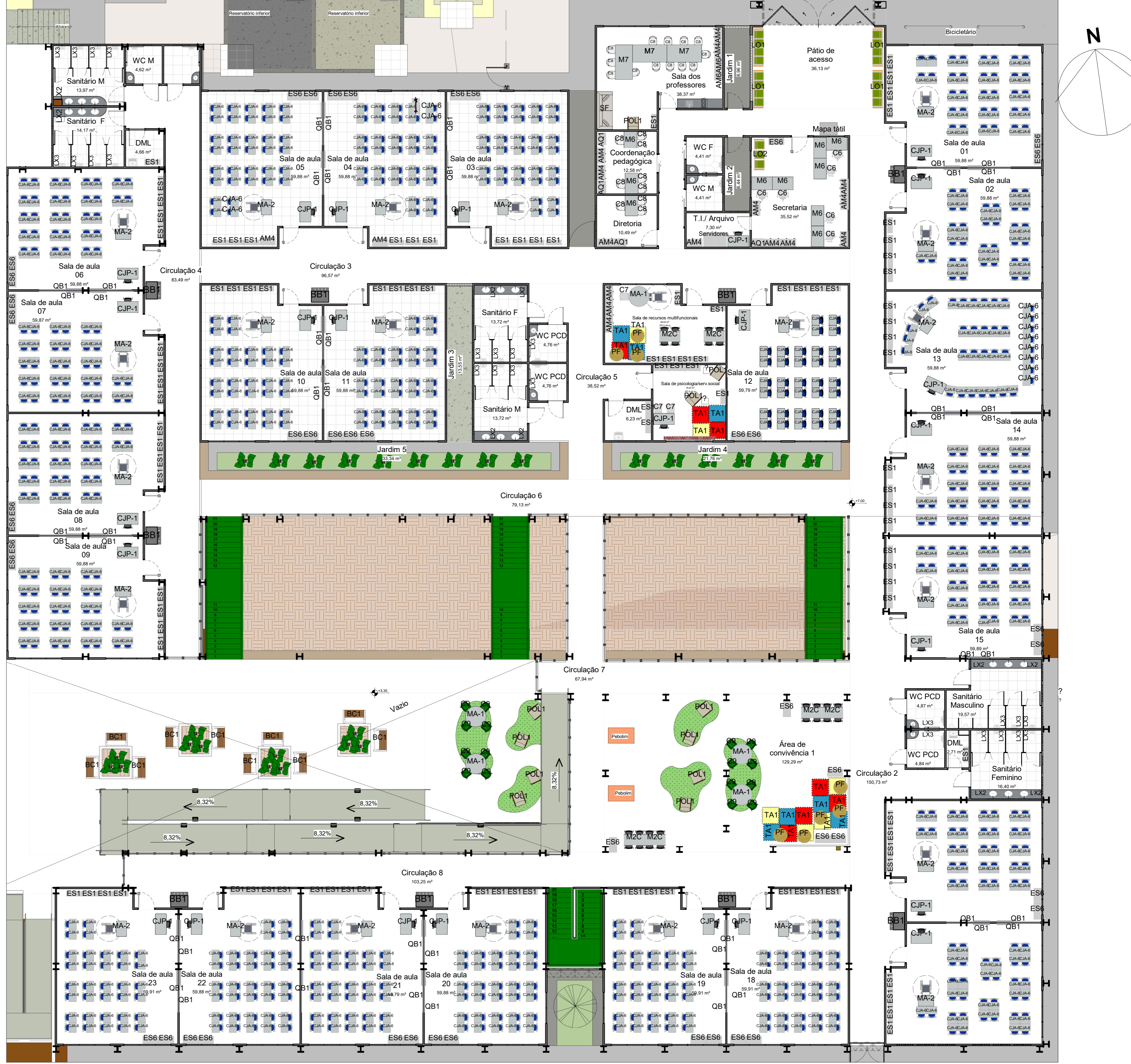
2 Planta de layout-Pav. inferior-nível+7m Escala: 1: 125