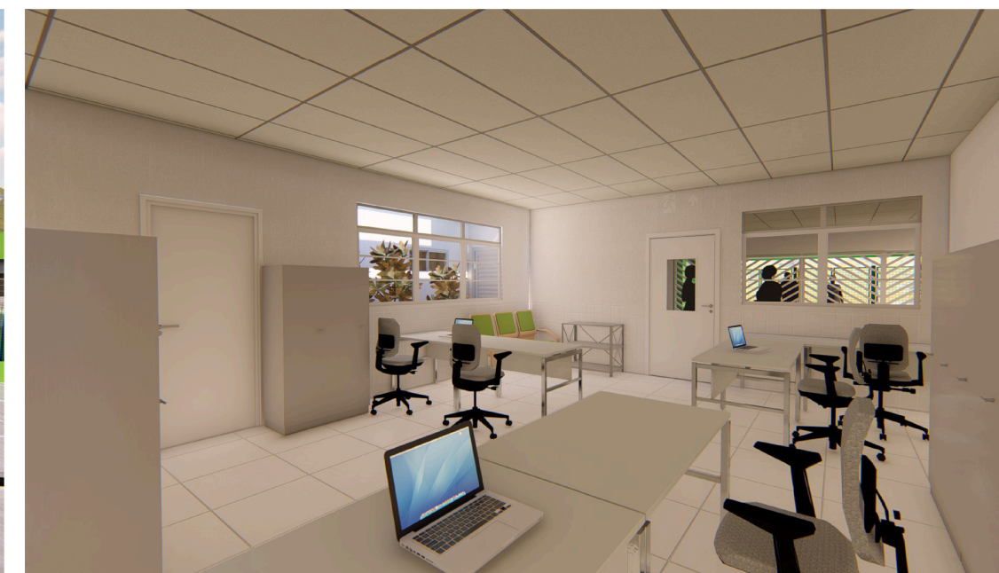
Imagem da secretaria