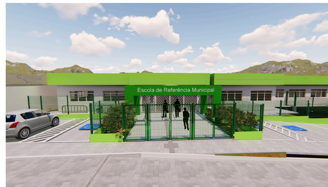
Imagem do acesso