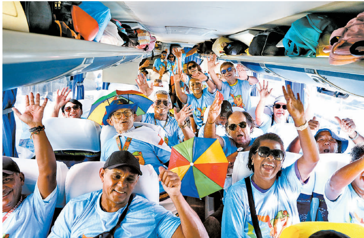
Entusiasmados, corredores enfrentarão viagem de três dias até São Paulo

Grupo formado por 46 corredores de Pernambuco embarca em ônibus do Recife para participar da centésima edição da maior corrida de rua da América Latina, em São Paulo